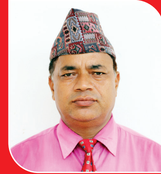
मानुमक्त अर्याल सदस्य