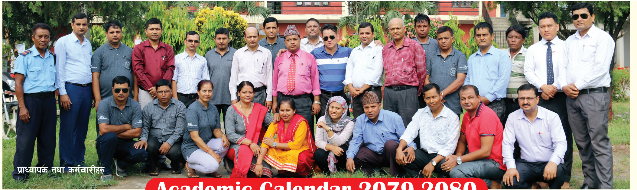
प्राध्यापक तथा कर्मचारीहरू