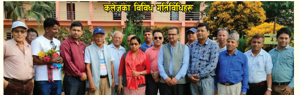
कलेजका विविध गतिविधिहरू